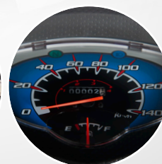
NUEVO TABLERO RETROILUMINADO