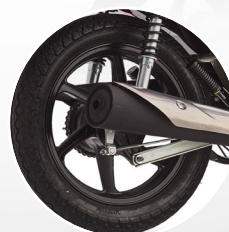
NUEVAS LLANTAS DE ALEACIÓN